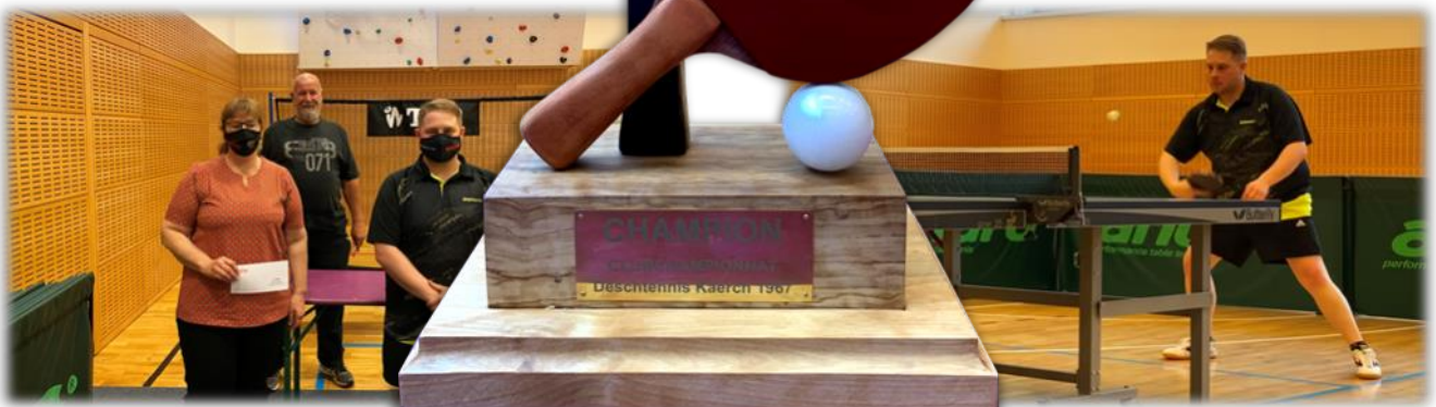
Neie Wanderpokal Clubchampionnat (Made by David GOELFF 2021)